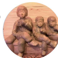
湯田良夫 （木彫・故人）