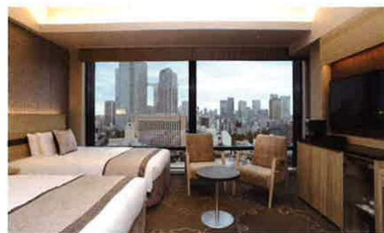
スーペリアフロア デラックスツイン 客室一例