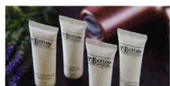
スーペリアフロア専用 アメニティ・コーヒーマシン

スーペリアフロアならではの客室設備や こだわりのアメニティーをご用意いたしました。 高層階ならではの東京都心の眺望をお楽しみください。