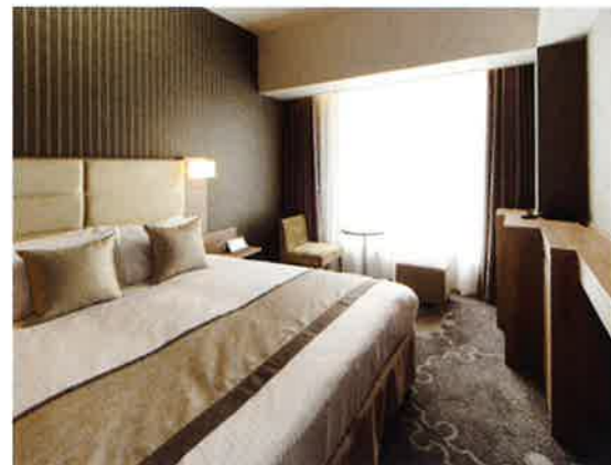
ダブルルーム 客室一例