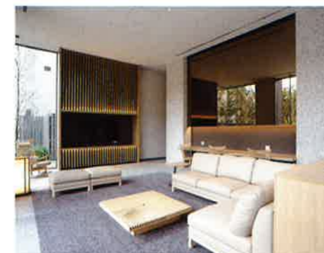
1階 ギャザリングスペース