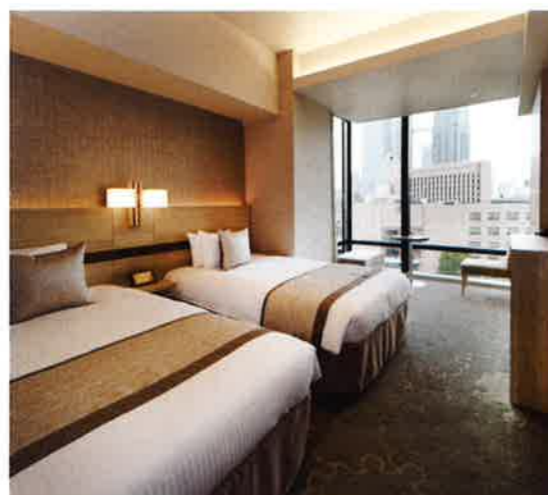
ツインルーム 客室一例