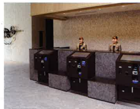
1階 フロントカウンター