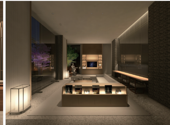
※CGは検討段階のもので実際とは異なる部分があります / CG提供：シリウスライティングオフィス